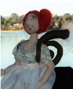
A semeadora de Chuvas Die Regen Säfrau The Rain Sower