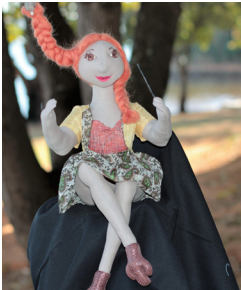
A Maestrina de Sabiás Die Sabiás Dirigentin The Master of Sabiás