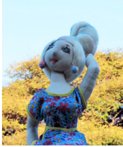
A Escultora de Nuvens Die Wolken Bildhauerin The Cloud Sculptor